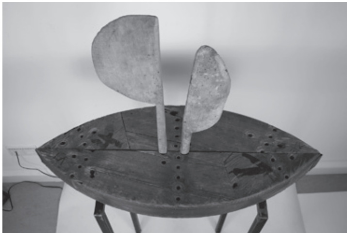
„S...Schiff II“, Museum Wasserburg, Inv.-Nr. 12377

Auch dieses Jahr präsentiert der AK68 wieder im Rahmen der Großen Kunstausstellung 2019 vom 28. Juli bis 25. August in der Galerie im Ganerhaus und im Rathaus zahlreiche eingereichte Kunstwerke. Im Museum Wasserburg wird zusätzlich die Jurorenaussstellung zu sehen sein.