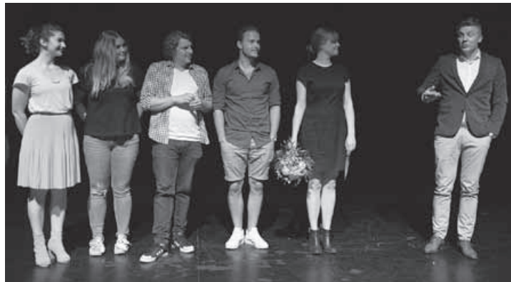
Der Zuschauerpreis ging an das Zentraltheater München.