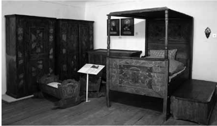
Bäuerliches Bett, 1805, Weichholz, bemalt, Museum Wasserburg, Inv.-Nr.: 51.

Objekt des Monats Juni - passende Sonderführung am 6. Juli